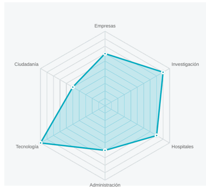
Flujo de Colaboración OneHealth

Colaboración intersectorial para mejorar la salud global y generar conocimiento compartido.