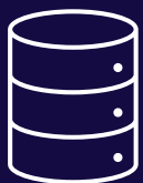
Catálogo de metadatos